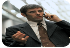
Fiscal Público Electoral (FPE)

X° Congreso Nacional de Derecho Político - Democracia y Estado de Derecho Asociación Argentina de Derecho Político – Mendoza, 27 y 28 de Junio de 2013