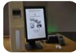
Voto Electrónico (e-vote)

X° Congreso Nacional de Derecho Político - Democracia y Estado de Derecho Asociación Argentina de Derecho Político – Mendoza, 27 y 28 de Junio de 2013