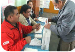
Autoridades de Mesa de Votación (AMV)