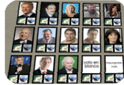
Boleta Única de Sufragio (BUS)